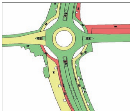
Digitale Stadtgrundkarte (Auszug) – Darstellung der Thematischen Auswertung der Zustandsbewertung

Mit der erweiterten Zertifizierung als Dienstleistungspartner für die Vermögensbewertung sind wir auf die individuellen Belange der Bewertungsverfahren und Möglichkeiten der Vermögensbewertung im ARCHIKART geschult.